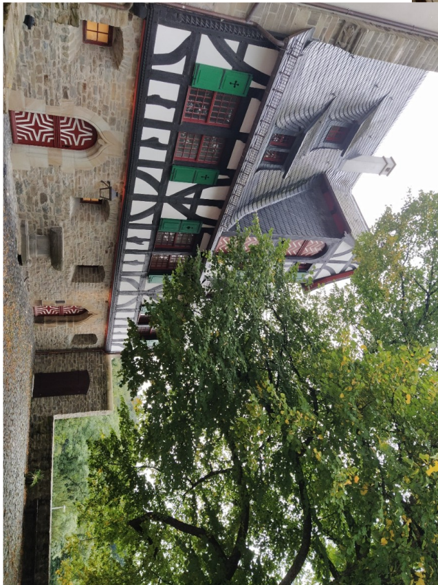
Toller Ausblick in alle Himmelsrichtungen und die Burg von schräg oben