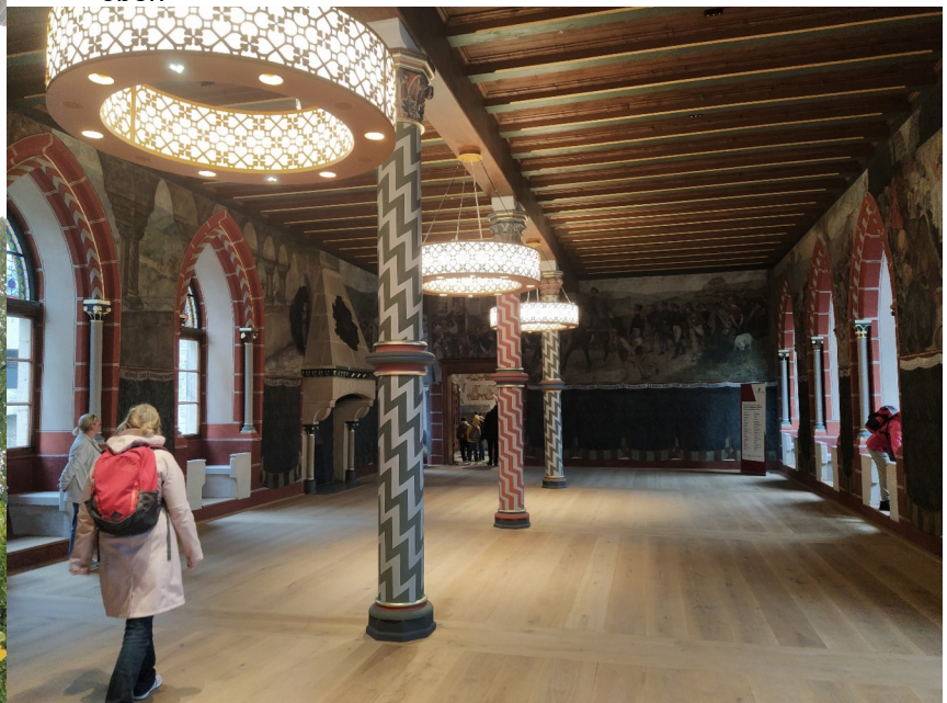
Der renovierte Rittersaal